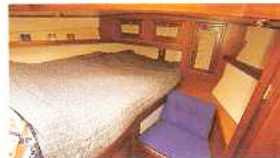
Het bed in de eigenaarshut voorin staat tegen de bakboordzij; dat levert in de hut veel ruimte op, onder meer voor kasten en een zitje.