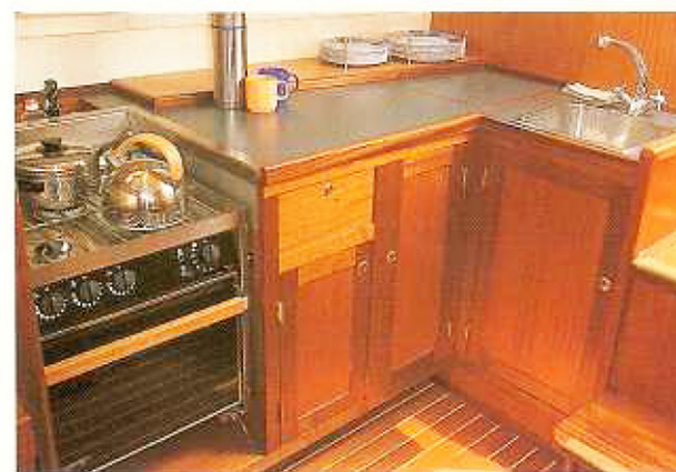
Grote kombuis met voldoende bergruimte.

schuifluik en garage. Bovendien zal op de volgende 36's een teakhouten koekkoek op de kajuit worden geplaatst.