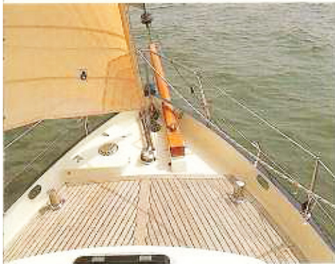
Een ruim, maar dankzij hoog boeisel en zeereling toch goed beschermd voordek.