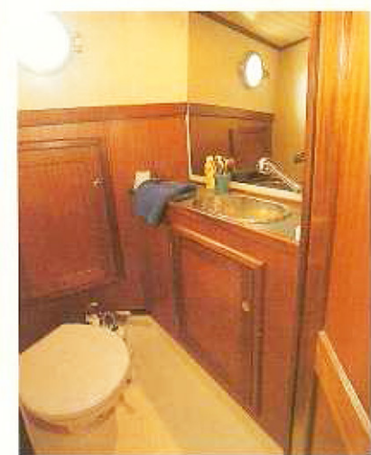
Ruime natte cel, afgewerkt met kunststof en mahonie.

Direct achter de voorhut vind je de grote natte cel en daar tegenover weer bergruimte en een natte kast. In de kajuit heb je natuurlijk te maken met de zwaardkast. Doordat daar bovenop de kajuitafel is geplaatst, ervaar je de kast echter niet als sta-in-de-weg. De bladen van de tafel kunnen worden neergeklapt; hij heeft een wat ongebruikelijke vorm, maar je kan er wel veel op